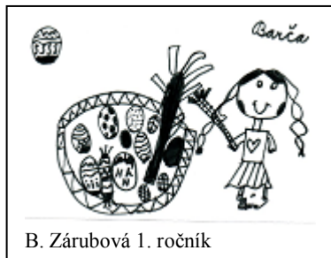
B. Zárubová 1. ročník