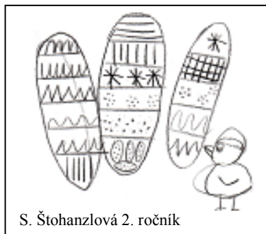
S. Štohanzlová 2. ročník