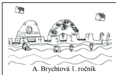
A. Brychtová 1. ročník