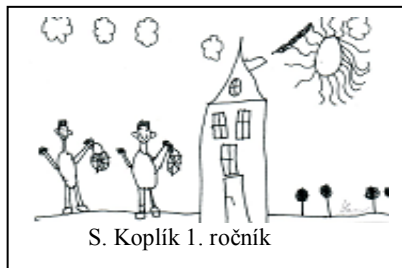
S. Koplík 1. ročník

26. března jsme byli v příbramském divadle. Ráno jsme se učili jen jednu a půl hodiny, pak se šli nasvačit, no a pak už přijel autobus, který nás odvezl do divadla. Bylo to tam hezké. Hráli pohádku Čertův švagr. Zahráli ji hezky a srandovně! Nakonec představení jsme si dokonce mohli všichni i zatancovat.