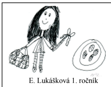
E. Lukášková 1. ročník