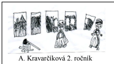
A. Kravarčíková 2. ročník