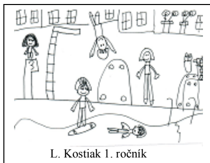
L. Kostiak 1. ročník