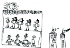
S. Koplík 1. ročník