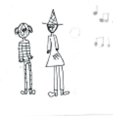
K. Šimůnková 2. ročník