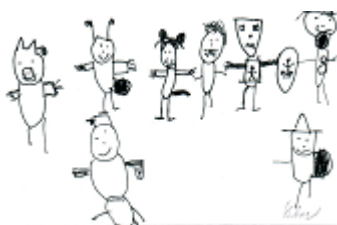
L. Handl 1. ročník

Projekt se vydařil, tak jak měl. Vyráběli jsme klauny, psali testy, malovali. Po svačině jsme šli do tělocvičny předvádět své vybrané pohádky. Všem se povedly. Byly krásné. Pak jsme tancovali, dělali všelijaké soutěže. Myslím, že to byl další šťastný den mého života.