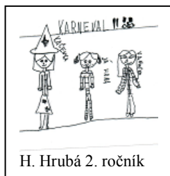
H. Hrubá 2. ročník