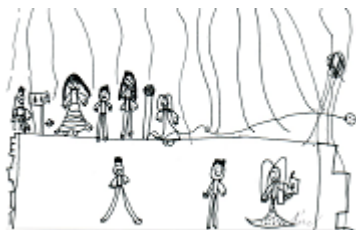
B. Zárubová 1. ročník