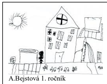
A. Bejstová 1. ročník