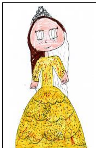
K. Sienbenbürger 2. ročník