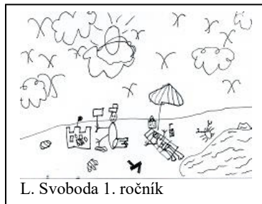
L. Svoboda 1. ročník