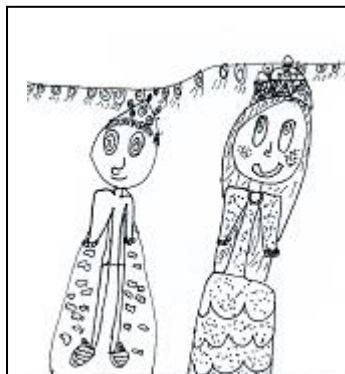
M. Helmich 2. ročník