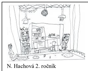
N. Hachová 2. ročník

8. června se konalo školní představení „O Popelce“. Před jeho začátkem někteří z nás, já byl mezi nimi, šli do zákulisí, aby měnili kulisy a někteří čekali pod schody. V polovině pohádky se nám vybil dva ze tří přenosných mikrofónů. Ale i tak se vše povedlo. Sklidili jsme velký potlesk. Na závěr nám pátákům pan ředitel popřál hodně úspěchů v novém školním roce.