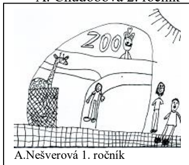
A. Nešverová 1. ročník