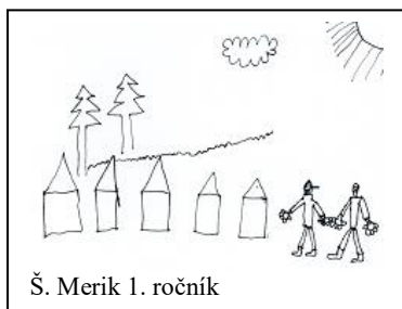
Š. Merik 1. ročník