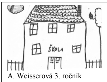
A. Weissarová 3. ročník