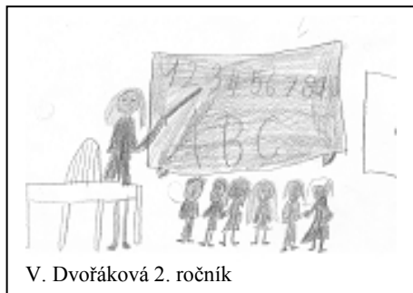
V. Dvořáková 2. ročník