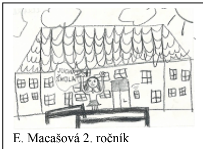
E. Macašová 2. ročník