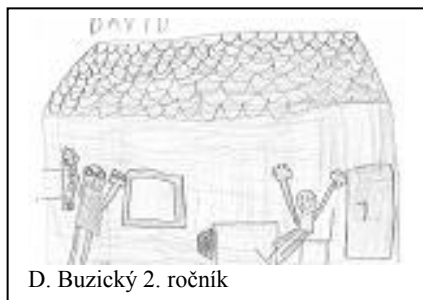
D. Buzický 2. ročník