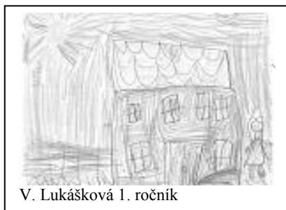
V. Lukášková 1. ročník