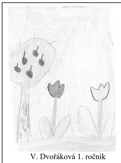
V. Dvořáková 1. ročník

Když rozkvetou louky, sady, pestřejší jsou než obrázky pana Lady. Svět je hned krásnější, obloha je jasnější. Slunce svítí, krásně hřeje, zmizely už sněhové závěje. Ptáci už se vrátili, svým zpěvem nás vzbudili. M. Hrubá – 4. ročník