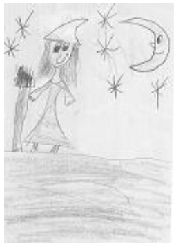
A. Weiseserová 2. ročník

Vyleť, hůlko, do vzduchu, proměníš se v ropuchu. V Tochovicích u Příbrami spadla jaga do ohrady. Divila se, kdo tam je, byl tam malý Dobroděj.