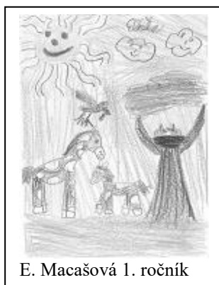
E. Macášová 1. ročník

Když rozkvetou louky, sady, pestřejší jsou než obrázky pana Lady. Svět je hned krásnější, obloha je jasnější. Slunce svítí, krásně hřeje, zmizely už sněhové závěje. Ptáci už se vrátili, svým zpěvem nás vzbudili. M. Hrubá – 4. ročník