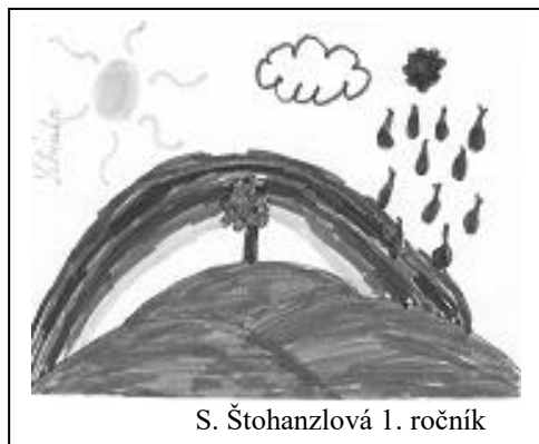
S. Štohanzlová 1. ročník